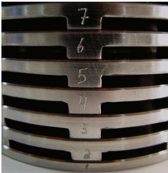
Figura 2 - Posição e Sequência de montagem dos discos

Nota: os cartuchos pequenos e não-soldados são construídos com um pino de guia para assegurar o correto alinhamento dos discos.